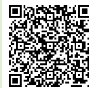
「ラーケーションの日」ポータルサイト

「ラーケーションの日」には、様々な活動ができます。どのような活動ができるのか、どうやって「ラーケーションの日」を取ればよいのかなど、興味をもった人は、おうちの方に配った「保護者用リーフレット」を見たり、右の二次元コードから、「ラーケーションポータルサイト」の「『ラーケーションの日』活動例」を見たりしながら、おうちの方と話し合ってください。