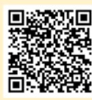
「ラーケーションの日」活動事例集