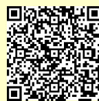
「ラーケーションの日」ポータルサイト

※ 県の Web ページ「ラーケーションの日」ポータルサイトには、計画づくりに活用できる「ラーケーションカード」や、いろいろな学びができる場所を紹介しています。参考にしてください。