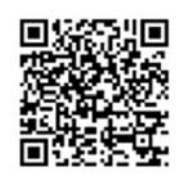
「ラーケーションの日」活動事例集